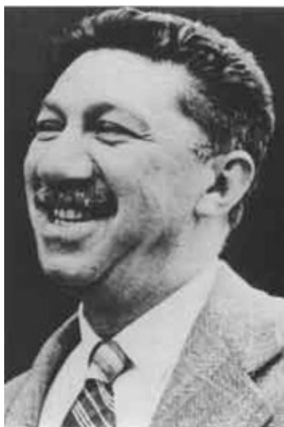
Абрахам Маслоу (1908-1970)

Значение исторических корней политической корректности нельзя осознать полностью, не поняв революцию сексуального перераспределения ролей Бетти Фридан как то, чем она являлась: проявлением социально-революционного процесса, который был начат Карлом Марксом. Ссылки Фридан на размышления Абрахама Маслоу об идеологии Франкфуртской школы – это только один индикатор этого. Другие – это совпадение революции сексуального перераспределения ролей Фридан с намерениями Дьёрдя Лукача уничтожить старые ценности и создать новые, и с переоценкой ценностей Герберта Маркузе. Но идею преобразования патриархата в матриархат – а это точно то, что должна была вызвать полная смена специфических половых ролей – можно проследить до книги Фридриха Энгельса «Происхождение семьи, частной собственности и государства». Эта книга впервые была опубликована в 1884 году и популяризовала принятое сегодня феминистское представление, что глубоко укорененная дискриминация против угнетенного женского пола – это орудие патриархата. Вера в то, что матриархат – это решение проблемы патриархата, происходит от комментариев Маркса к появившейся в 1845 книге «Die deutsche Ideologie» («Немецкая идеология»). В этой книге Маркс развивает предположение, что женщины и дети – это самое важное владение патриархальных мужчин. Матриархальная теория Франкфуртской школы и родственная ей теория андрогинности, они обе происходят из этих источников.