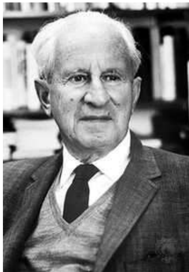
Герберт Маркузе (1898-1979)

На студенческих революционеров также очень сильно повлияли идеи Герберта Маркузе, еще одного члена Франкфуртской школы. Маркузе проповедовал «Великий отказ» (неприятие всех основных западных концепций), сексуальную свободу и ценность сопротивления феминисток и негров. Его первоначальный тезис был, что университетские студенты, негры из гетто, отчужденные, асоциальные элементы и третий мир могли бы занять место пролетариата в коммунистической революции. В своей книге «Эссе об освобождении» Маркузе представил свои цели радикального переворота ценностей: отмена табу, культурный переворот, Критическую теорию, и революцию в области лингвистики, которая должна была привести к методическому изменению значений используемых слов. О расовом конфликте Маркузе писал, что белые мужчины виновны, и черные представляют собой самую естественную силу мятежа.