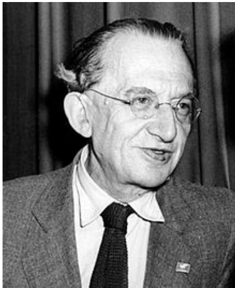
Дьёрдь (Георг) Лукач (1885-1971)

Когда он в 1919 году стал заместителем народного комиссара просвещения в большевистском правительстве Бела Куна в Венгрии, Лукач начал осуществлять программу, которая стала известна как культурный терроризм. Как часть этой программы он ввел в венгерских школах радикальную программу сексуального образования. Венгерским детям рассказывали о свободной любви и сексуальных отношениях и также учили их тому, что семейный кодекс среднего класса архаичен, моногамия устарела, а религия, которая скрывала от людей все мирские радости, не имеет значения. Женщин также призывали восстать против нравов и обычаев времени. Кампания культурного терроризма Лукача была предшественницей того, что позже политическая корректность принесла в американские школы.