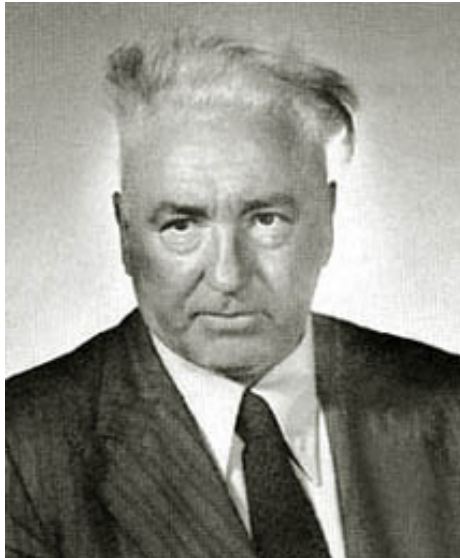
Вильгельм Райх (1897-1957)

Кроме того, он написал книгу «Сексуальная революция», которая была предвестником событий 1960-х годов.