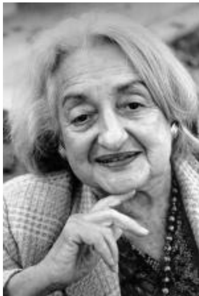
Бетти Фридан (1921-2006)

Одним из людей, которые внесли самый большой вклад в политическую корректность, была Бетти Фридан. В своей книге «Тайна женственности или самоосвобождение женщины. Программа эмансипации» она связала феминизм и теорию Абрахама Маслоу о самоактуализации (самовыражении). Маслоу был социальным психологом, который в молодости занимался исследованиями о доминировании женщин и сексуальности. Маслоу был другом Маркузе в Университете Брендэйса и познакомился с Эрихом Фроммом в 1936 году. На него оказала сильное воздействие идеология Франкфуртской школы Фромма. В 1944 году им была опубликована статья «Структура авторитарного характера», которая отражала теорию личности в рамках Критической теории. Также на Маслоу произвели впечатление труды Вильгельма Райха, который был еще одним автором теории личности Франкфуртской школы.