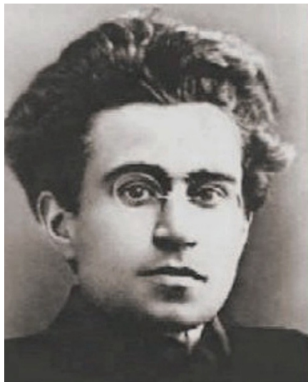
Антонио Грамши (1891-1937)

Антонио Грамши работал в 1923-24 в Москве и Вене для Коммунистического Интернационала (Коминтерна). Позже он был арестован и сидел в одной из тюрем Муссолини, там он написал свои ныне знаменитые «Тюремные тетради». Среди марксистов Грамши известен своей теорией культурного господства как средства классового доминирования. С его точки зрения, сначала нужно было создать нового «коммунистического человека», прежде чем политическая революция будет возможна. Это, в свою очередь, привело к тому, что эти интеллектуалы усиленно посвятили себя сферам образования и культуры. Грамши представлял себе долгий марш через общественные институты, т.е. правительство, органы правосудия, армию, школы и средства массовой информации. Он также сделал вывод, что, до тех пор, пока рабочие остаются христианами, они не станут реагировать на революционные призывы.