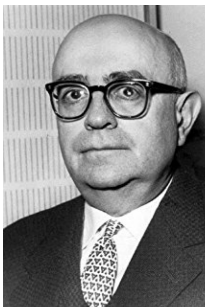
Теодор Адорно (1903-1969)

Вместе с другими Адорно был автором опубликованной в 1950 году книги «Исследование авторитарной личности».