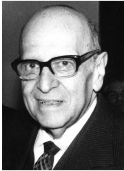
Макс Хоркхаймер (1895-1973)

посту директора Института в июле 1930 года), не выявление неизменных истин, а содействие общественному перевороту».