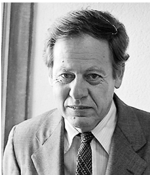
Поль де Ман (1919-1983)

Естественно, Деррида быстро стал любимцем истеблишмента американского народного образования. Он читал лекции в университетах Восточного побережья США и начал любить этот регион Америки. Уже скоро Америка ответила взаимностью на эту привязанность, предоставив ему место на факультете английского языка в Йельском университете. Затем Йель привлек еще гораздо больше деконструктивистов и постмодернистов, таких как Дж. Хиллис Миллер, Джеффри Хартман и другие. Еще один европеец, Поль де Ман, тоже приехал в Америку и начинал преподавать деконструктивизм. В истории де Мана кроется еще одна причина, из-за которой деконструктивисты так страстно пытались освободить язык от его значения. Де Ман перед Второй мировой войной работал для определенно дружественной к нацистам газеты. Противники де Мана снова и снова указывают на то, что устранение значения из языка является превосходным способом, чтобы в дискуссиях заболтать и оставить без внимания пронацистское содержание его произведений.