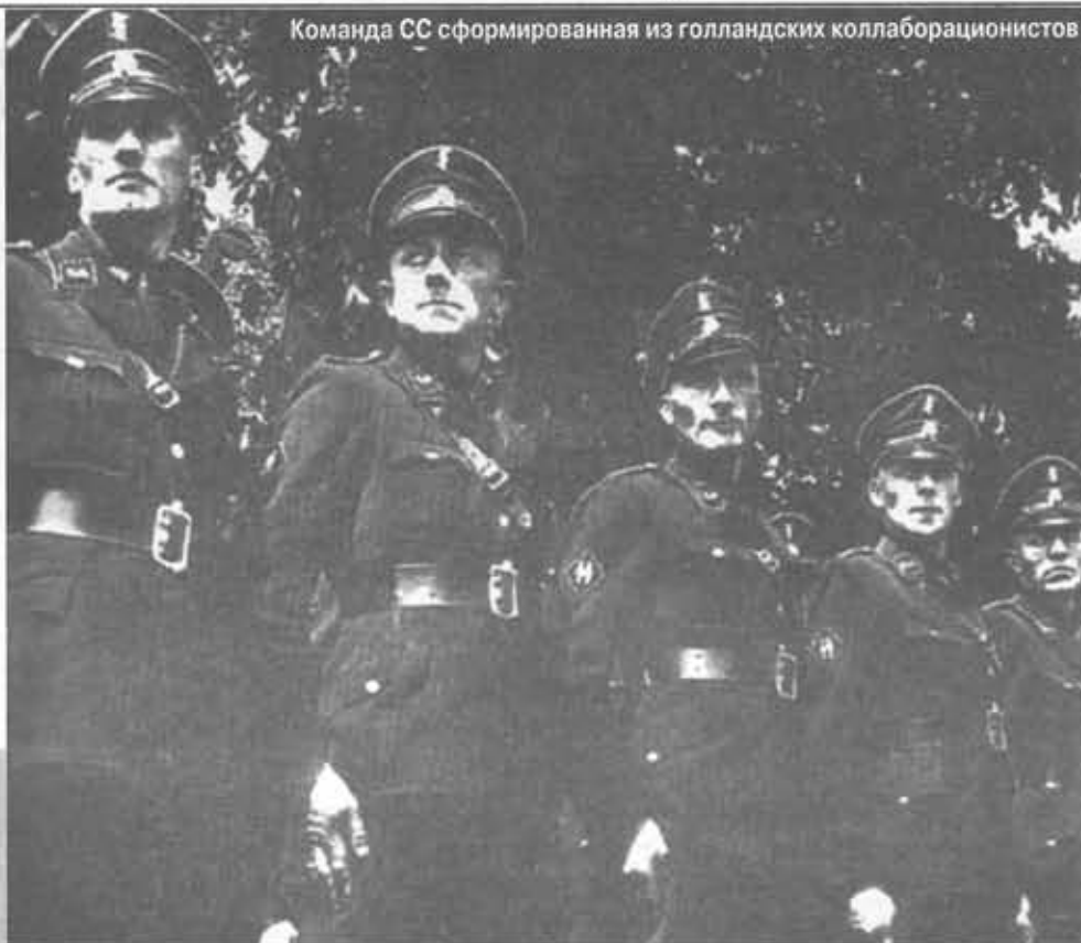
Команда СС сформированная из голландских коллаборационистов