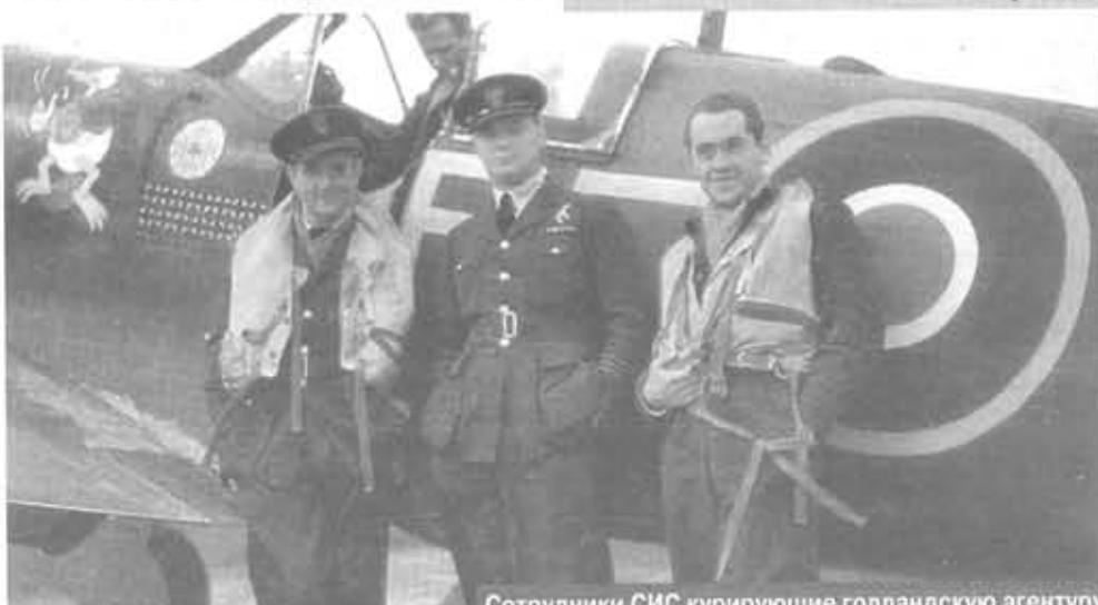
Сотрудники СИС курирующие голландскую агентуру