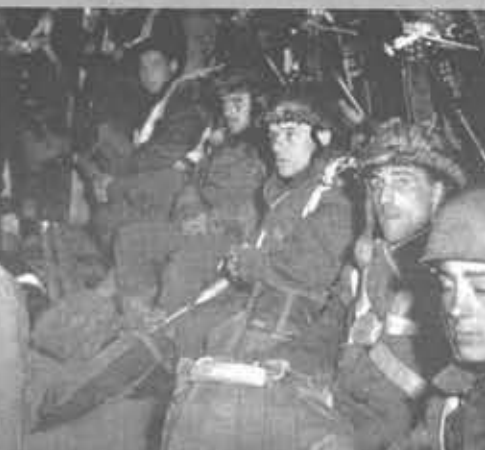
Агенты британской разведки перед высадкой

ми, но, что значительно хуже, в итоге повлекли за собой крах всей разведывательной сети различных британских спецслужб в Голландии, Франции и Бельгии, а также разгром организаций Сопротивления и многочисленные человеческие жертвы. Из засланных в Нидерланды в период с мая 1940 по сентябрь 1944 годов по каналам СОЕ 157 агентов были арестованы 70, погибли по различным причинам 72. Немцы вели радиоигру с Лондоном через 14 (по некоторым данным, 17) передатчиков, отправив от 2 до 4 тысяч дезинформационных сообщений. Они контролировали 30 постоянных районов и 65 разовых точек приема людей и грузов с британских самолетов, захватив предназначенные для оснащения групп Сопротивления 3000 пистолетов-пулеметов, 300 пулеметов, 500 пистолетов, полмиллиона патронов, 15 тонн взрывчатки, радиопередатчики, продовольствие, медикаменты, обувь, одежду и значительные суммы наличных денег. Но наиболее тяжелым следствием провалов стала, естественно, гибель людей. В одном только Маутхаузене были казнены или умер-