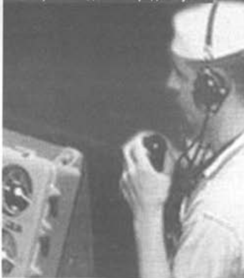
В центре по подготовке радио-«уток»

сывавшиеся для проверки сетей СОЕ агенты, о прибытии которых центр намеренно не сообщил агентуре «в поле», вылетели в одном самолете вместе с пятью обычными агентами. Всех их ожидали немцы, внезапно для себя захватившие на двух человек больше, чем планировали. В середине февраля 1943 года два пьяных эсэсовца из охраны проговорились на вечеринке, что немцы арестовали в Голландии десятки британских агентов и захватывают все присылаемое для них снабжение. Присутствовавший там же участник Сопротивления зафиксировал эту информацию и по цепочке передал ее в Лондон, но до СОЕ она не дошла, поскольку одним из