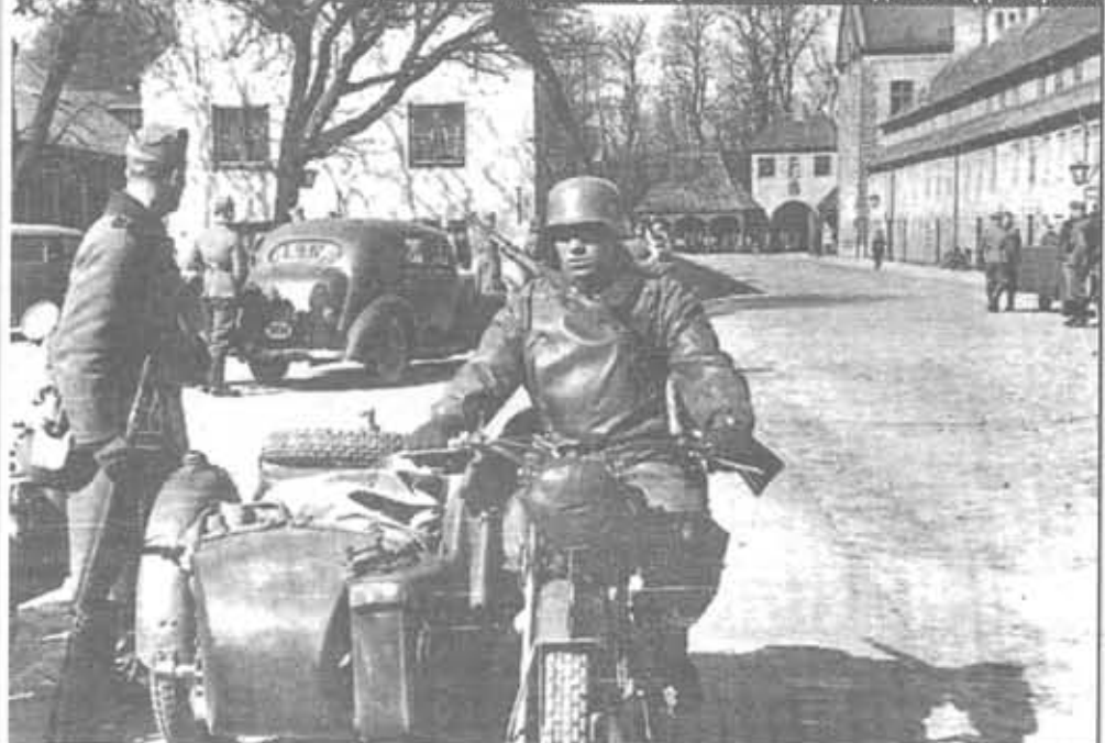
Солдаты Вермахта на оккупированных голландских территориях