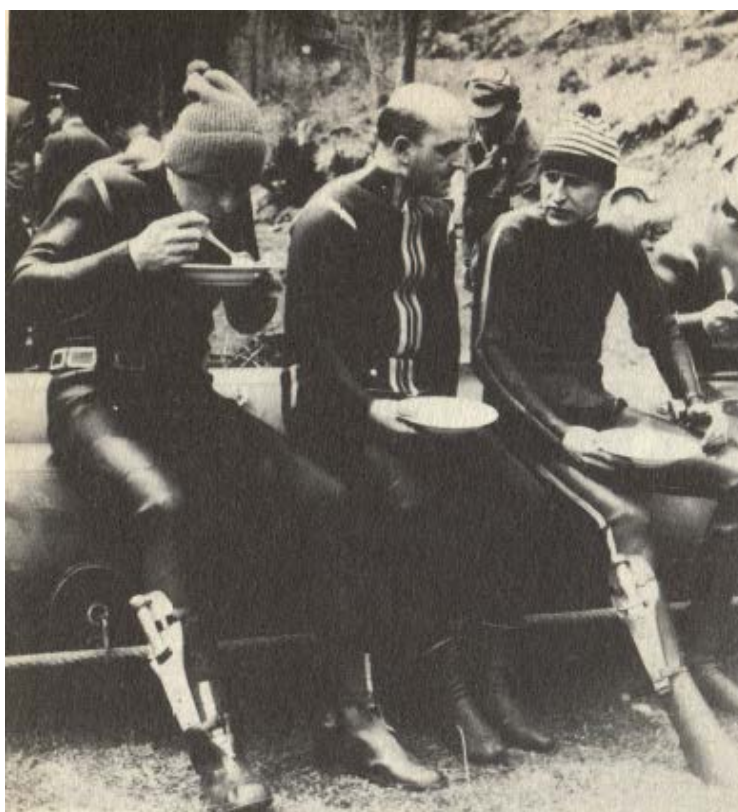
Спортсмены-подводники в момент перерыва во время киносъемок на Чертовом озере (в центре – автор).

Министерство внутренних дел благодарит всех тех граждан, которые за прошедшие недели дали его органам ценные указания в отношении возможных мест хранения нацистских материалов. Министерство обращается к общественности с просьбой об информации, которая могла бы помочь обнаружить и последующие нацистские тайники, которые были устроены на нашей территории в последние месяцы войны. Всю информацию надлежит отправлять секретариату Министерства внутренних дел».