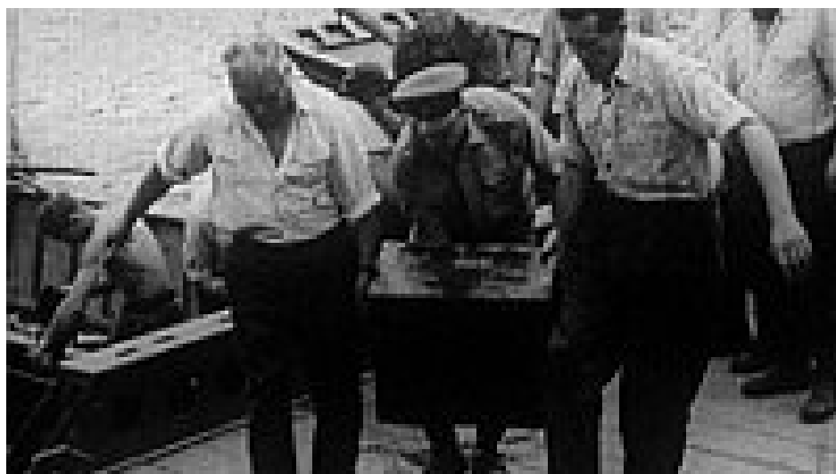
«Акция Нептун – Черное озеро»

После жесткого сталинизма 1950-х годов в 1960-е наступает «оттепель» и в Чехословакии. Тем не менее, в 1965 году должен был подойти к концу двадцатилетний срок давности военных преступлений, совершенных во время Второй Мировой войны. С точки зрения чехословацкой стороны, та денацификация, которая проходила в Западной Европе и, особенно в Германии, была недостаточной; большое количество военных преступлений осталось безнаказанными, а военные преступники продолжали разгуливать на свободе. В чешских списках значились тысячи имен военных преступников, значительная часть которых как раз находилась на территории Западной Германии.