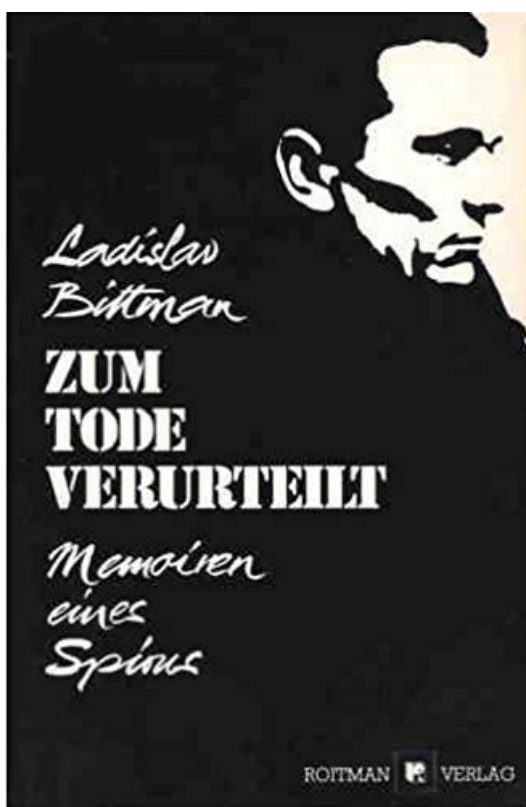
Обложка книги Биттмана «Приговорен к смерти. Мемуары шпиона»

В США Мартин-Биттман в 1974 году стал профессором Бостонского университета, читал лекции о международных средствах массовой информации, в особенности о дезинформации и обработке общественного мнения. Он написал несколько книг о приемах дезинформации в Восточном блоке и о роли КГБ в этой деятельности. В 1996 году после сердечного приступа Биттман оставил свой пост в университете и, продолжая проживать в Рокпорте, штат Массачусетс, посвятил себя своему хобби – изобразительному искусству.