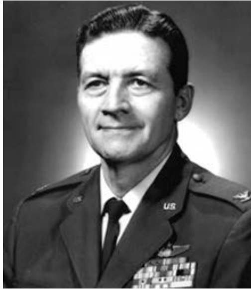
Джон Бойд (1927-1997)

Так мы видим два главных катализатора для изменения в предыдущих сменах поколений: технология и идеи. Какое представление мы получим от этих более ранних изменений, когда бросим взгляд на потенциальное четвертое поколение войны?