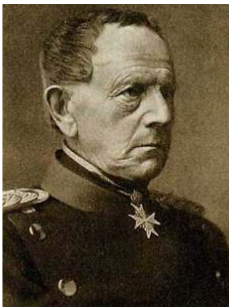
Гельмут Карл Бернхард фон Мольтке (старший) (1800-1891)

Второе поколение стало свидетелем формального признания и принятия оперативного искусства, первоначально прусской армией. И снова движущими силами этого изменения были как идеи, так и технология. Идеи исходили в значительной степени от прусских исследований кампаний Наполеона. Технологические факторы включали понимание фон Мольтке того, что современная тактическая огневая мощь дала возможность осуществлять сражения на окружение и желание использовать возможности железных дорог и телеграфа.