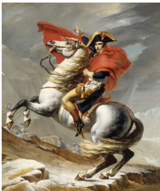
Наполеон Бонапарт (1769-1821)

Война первого поколения отражает тактику эры гладкоствольного мушкета, тактику линий и колонн. Эта тактика развилась частично в ответ на технологические факторы – линия максимизировала огневую мощь, жесткая муштра была необходима, чтобы добиться высокой скорострельности и т.д. – и частично в ответ на общественные условия и идеи, например, колонны французских революционных армий отражали как высокий моральный дух революционных стремлений, так и низкий уровень подготовки набранных по всеобщему призыву солдат. Хотя с заменой гладкоствольного ружья нарезным мушкетом эта тактика стала считаться устаревшей, но остатки тактики первого поколения дожили до наших дней, особенно в часто встречающемся желании линейности на поле битвы. Оперативное искусство в первом поколении не существовало как понятие, хотя оно и практиковалось некоторыми отдельными полководцами, наиболее заметным из которых был Наполеон.