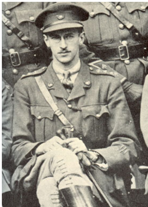
Бэзил Генри Лиддел Гарт (1895-1970)

Хотя фундаментальные понятия тактики третьего поколения существовали уже к концу 1918 года, добавление нового технологического элемента – танков – привело к важнейшему изменению на оперативном уровне во Второй мировой войне. Этим изменением был Блицкриг, «молниеносная война». В Блицкриге основа оперативного искусства сместилась с места (как в не прямых действиях Лиддел Гарта) на время. Это изменение было однозначно признано только недавно в трудах полковника ВВС США в отставке Джона Бойда и его «теории OODA (наблюдение – ориентация – решение – действие)».